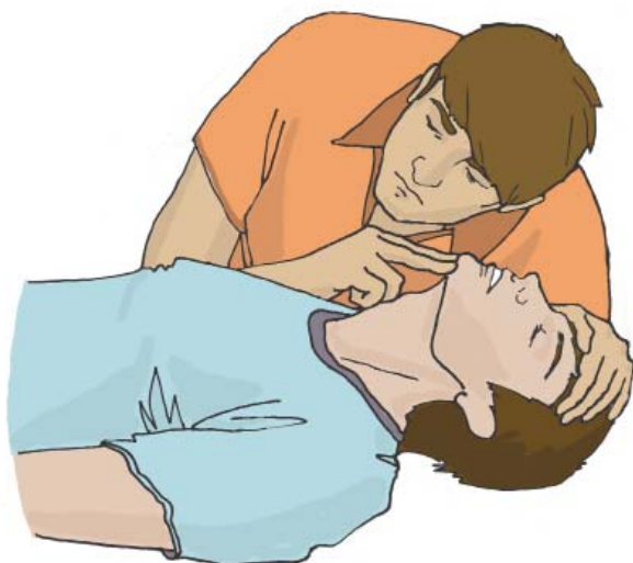
Проверка наличия дыхания с помощью слуха, зрения и осязания

Для проверки дыхания следует наклониться щекой и ухом ко рту и носу пострадавшего и в течение 10 сек. послушать дыхание, почувствовать его своей щекой и посмотреть на движения грудной клетки. При отсутствии дыхания грудная клетка пострадавшего останется неподвижной, звуков его дыхания не будет слышно, выдыхаемый воздух изо рта и носа не будет ощущаться щекой. Отсутствие признаков дыхания определяет необходимость вызова скорой медицинской помощи и проведения сердечно-легочной реанимации.