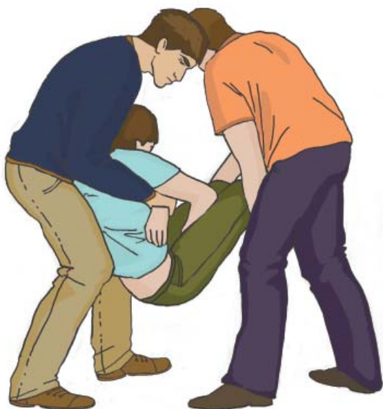
Переноска пострадавшего двумя работниками

После извлечения следует попросить помощника подхватить пострадавшего за ноги и переместить его в безопасное место. Переноску пострадавшего следует осуществлять аккуратно, в щадящем режиме для снижения риска причинения ему дополнительных повреждений и страданий.