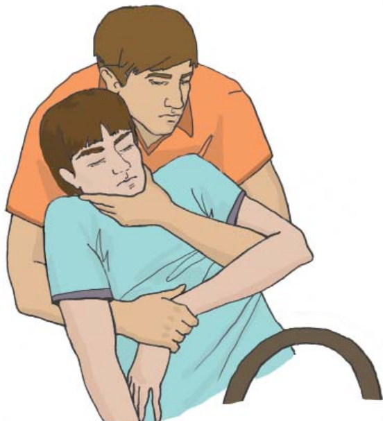
Фиксация головы пострадавшего рукой

При извлечении пострадавшего, находящегося без сознания или с подозрением на травму шейного отдела позвоночника, необходимо фиксировать ему голову и шею. При этом одна из рук участника оказания первой помощи фиксирует за нижнюю челюсть голову пострадавшего, а вторая держит его противоположное предплечье.