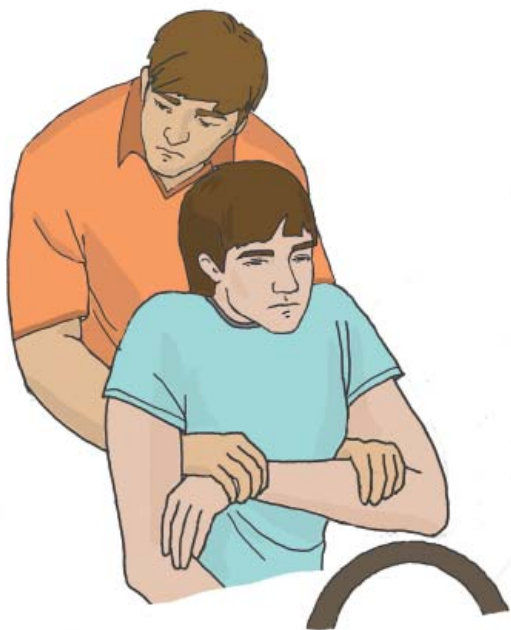
Фиксация пострадавшего за предплечье при извлечении из автомобиля

К устранению угрожающих факторов также относится экстренное извлечение пострадавшего из автомобиля или труднодоступного места в случае, если он не может выбраться самостоятельно. Извлечение пострадавшего выполняется только при наличии угрозы для его жизни и здоровья и невозможности оказания первой помощи в тех условиях, в которых находится пострадавший. В зависимости от наличия или отсутствия сознания пострадавший должен извлекаться различными способами. Если пострадавший находится в сознании, его экстренное извлечение производится так: руки участника оказания первой помощи проводятся под мышками пострадавшего, фиксируют его предплечье, после чего пострадавший извлекается наружу.