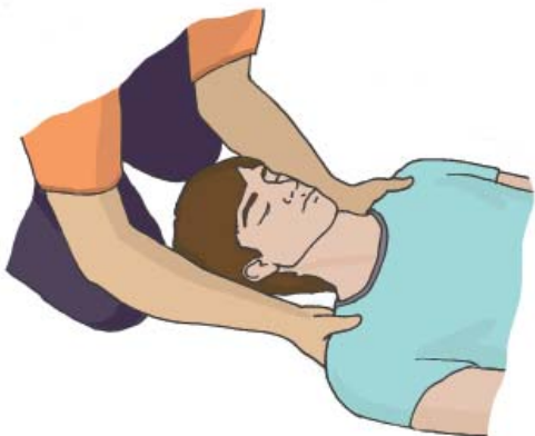
Фиксация головы и шеи пострадавшего с подозрением на травму позвоночника предплечьями участника оказания первой помощи при его подъеме и переноске

При переноске необходимо фиксировать голову и шею пострадавшего предплечьями.