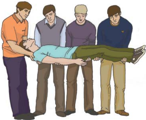
Переноска пострадавшего с подозрением на травму позвоночника

Для переноски пострадавшего с подозрением на травму позвоночника необходимо несколько человек, которые под руководством одного из работников поднимают и переносят пострадавшего.