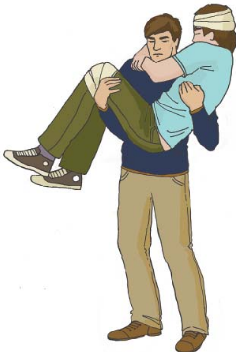
Переноска пострадавшего на руках

Используется работниками, имеющими значительную физическую силу. Этим способом возможна переноска бессознательных пострадавших. Нежелательно переносить так пострадавших с подозрением на травму позвоночника.