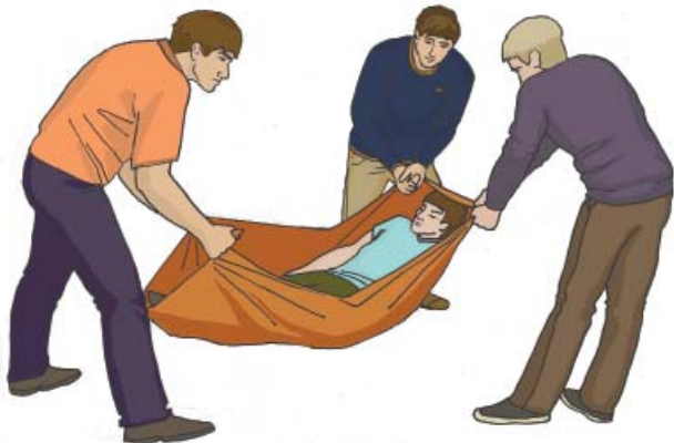
Переноска пострадавшего на носилках

При переноске на дальние расстояния целесообразно использовать табельные или импровизированные мягкие носилки. При этом один из работников обязательно должен руководить процессом перекладывания пострадавшего на носилки и их подъема.