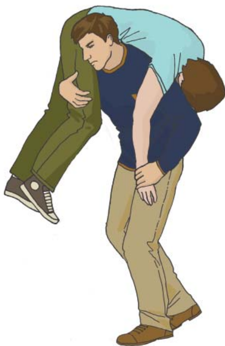
Переноска пострадавшего в одиночку на плече

При переноске таким способом следует поддерживать пострадавшего за руку. Этот способ не применяется при переноске пострадавших с травмами груди и живота.