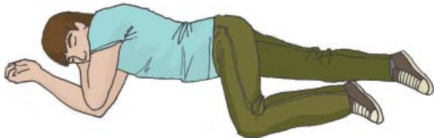
Устойчивое боковое положение

Пострадавшему без сознания необходимо придать устойчивое боковое положение.