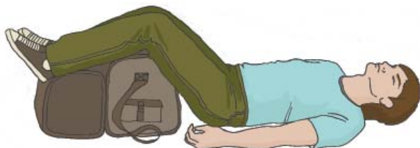
Положение на спине с приподнятыми ногами

Пострадавший с сильным наружным кровотечением или признаками внутреннего кровотечения должен находиться в положении лежа на спине с приподнятыми ногами, под которые подкладываются сумки или одежда.