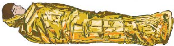
Применение спасательного покрывала

Пострадавшие с тяжелыми травмами должны быть закутаны в спасательное одеяло, серебристой стороной к телу.